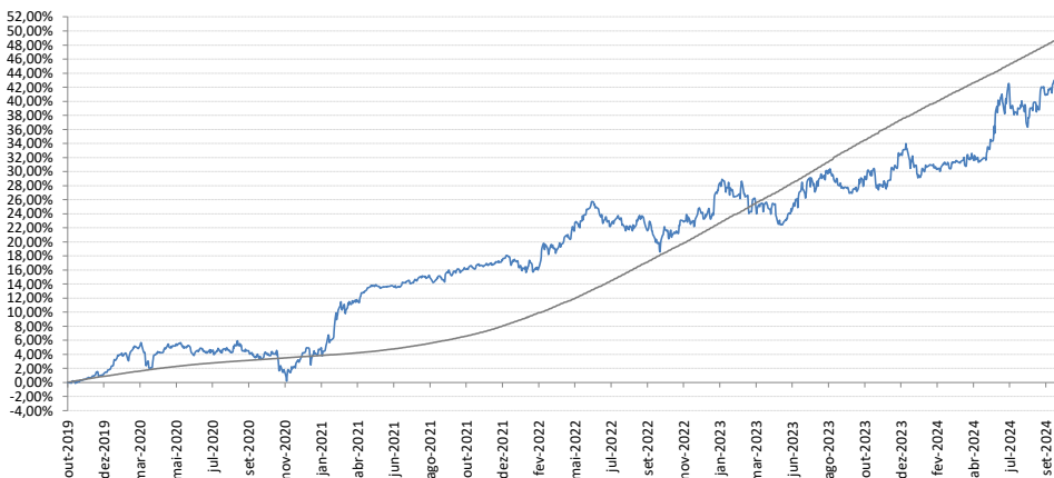
Gráfico de Rentabilidade - ENTERCAPITAL TURING FIC FIM