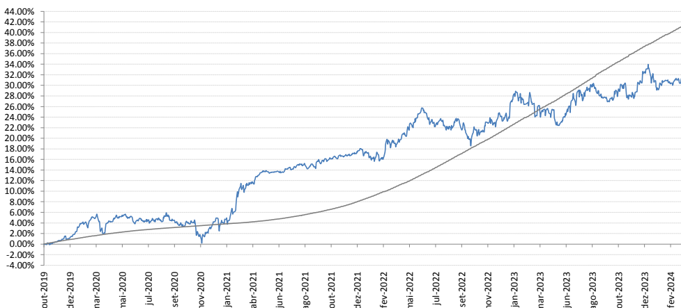
Gráfico de Rentabilidade - ENTERCAPITAL TURING FIC FIM